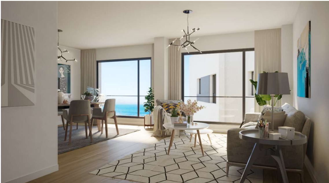
Salon en vivienda tipo T en planta 3. Los ventanales con formato balcón solo están disponibles en las viviendas planta 2 y 3 con fachadas al mar.